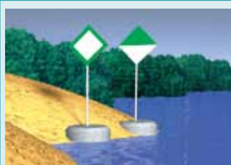
Rys. 5.67. Znaki brzegowe przebiegu szlaku żeglownego blisko lewego brzegu.