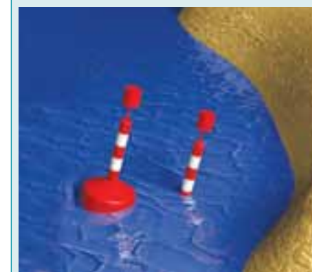
Rys. 5.73. Znaki pływające przy prawym brzegu; oznakowanie miejsc niebezpiecznych i przeszkód żeglugowych.

Światło: białe rytmiczne migające lub izofazowe (może być zastąpione światłem migającym z trzema błyskami w grupie)