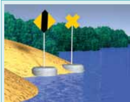
Rys. 5.69. Znaki na lewym brzegu wskazujące przejście szlaku żeglownego od lewego do prawego brzegu.

Światło: żółte rytmiczne przerywane lub błyskowe w grupach, z parzystą liczbą błysków w grupie, z wyjątkiem dwóch