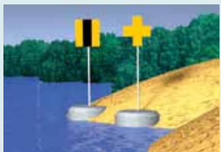
Rys. 5.68. Znaki na prawym brzegu wskazujące przejście szlaku żeglownego od prawego do lewego brzegu.

Światło: zielone rytmiczne (rytm dowolny)