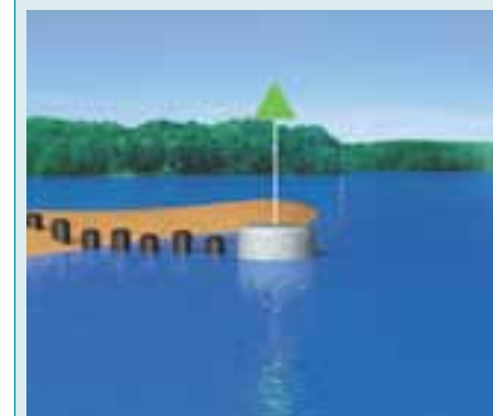
Rys. 5.71. Znak stały na lewym brzegu; oznakowanie miejsc niebezpiecznych i przeszkód żeglugowych.

Światło: czerwone rytmiczne (rytm dowolny)