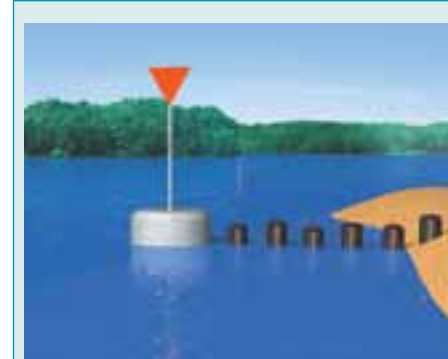
Rys. 5.70. Znak stały na prawym brzegu; oznakowanie miejsc niebezpiecznych i przeszkód żeglugowych.