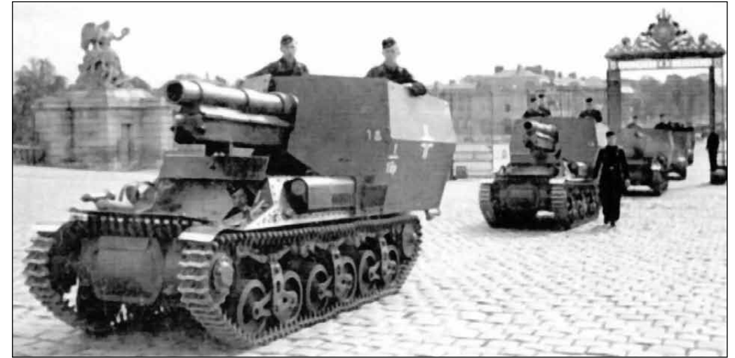
Kolumna dział samobieżnych 15 cm sFH 13/1 (Sf) auf G.W. Lr.S. (f) z 1. lub 2. Pancernych Pułków Artylerii (gepanzerter Artillerie Regiment), Francja, koniec 1942 roku.

Niewielka liczba tych dział była wykorzystywana w Wehrmachcie do szkolenia artylerzystów. Broń ta znajdowała się podczas II wojny światowej również w uzbrojeniu niektórych baterii artylerii nadbrzeżnej i fortecznej.