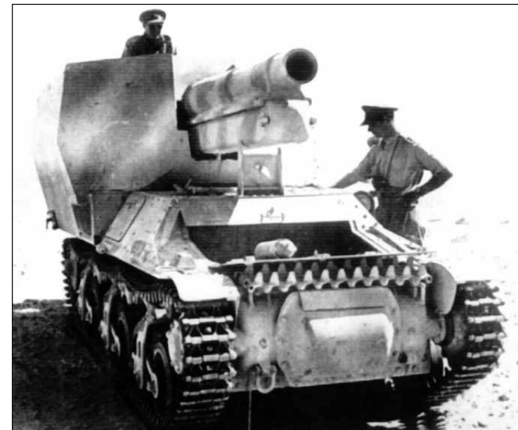
Oficerowie brytyjscy oglądają zdobyte podczas walk pod Al-Alamajn niemieckie działo samobieżne 15 cm sFH 13/1 (Sf) auf G.W. Lr.S. (f), wrzesień–listopad 1942 roku.

na otrzymała zamówienie na przebudowanie 30 ciągników Lorraine 37L na haubice samobieżne z działami sFH 13. Pojazd otrzymał oznaczenie 15 cm sFH 13/1 (Sf) auf Geschützwagen Lr.S. (f) . W systemie oznaczeń pojazdów Wehrmachtu przydzielono mu indeks Sd.Kfz. 135/1 . Do końca miesiąca zlecenie wykonano